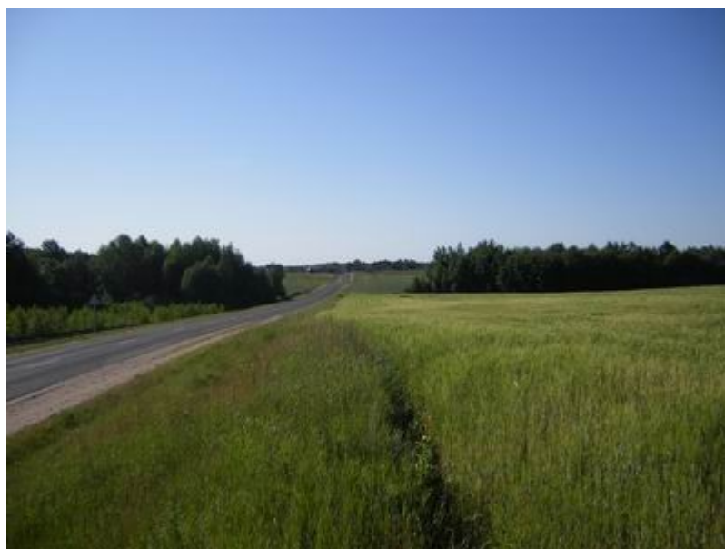
2. Вид с позиции Удино, утро 28.11.12.