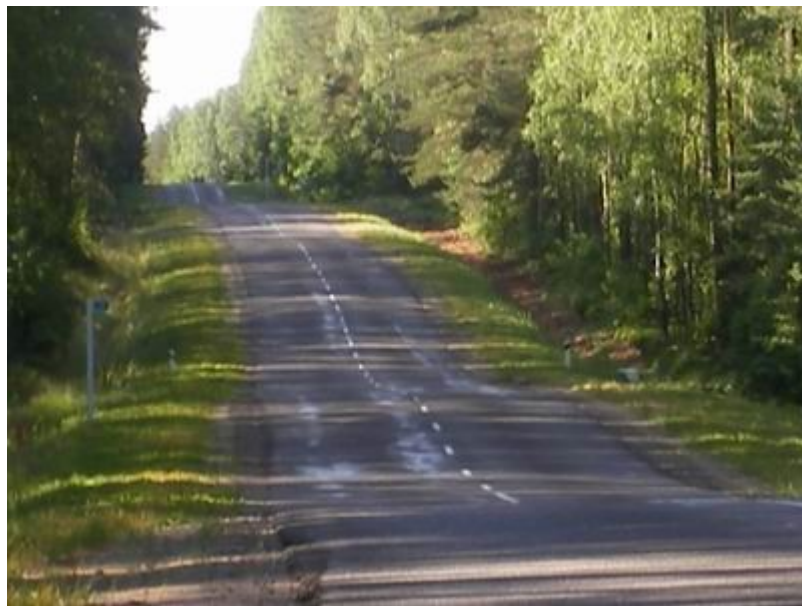
4. Вид с батареи французов, день.