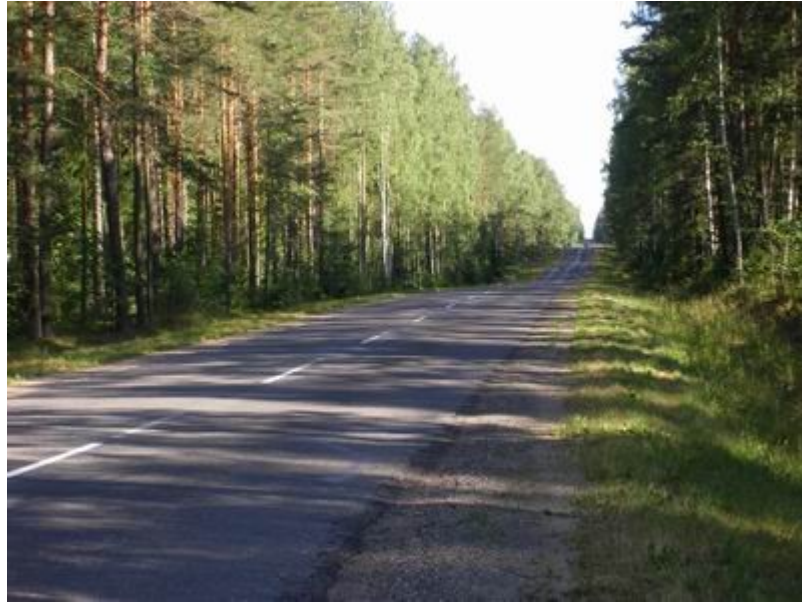
3. Вид с батареи Арнольди, день.