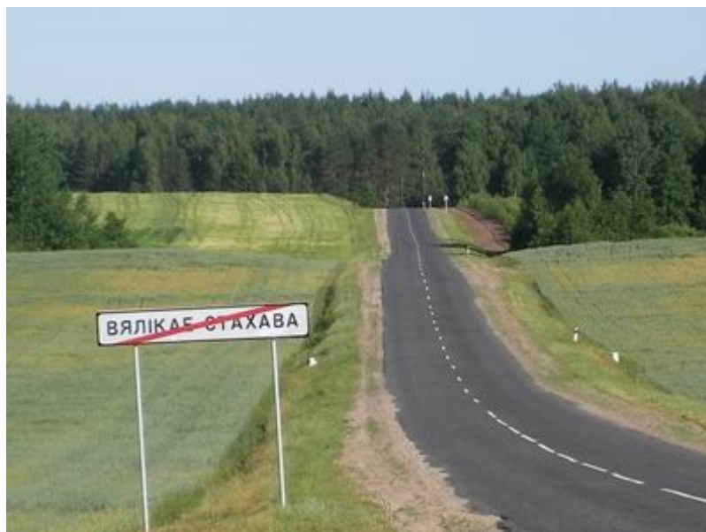
1. Вид с позиции Арнольди, утро 28.11.12.